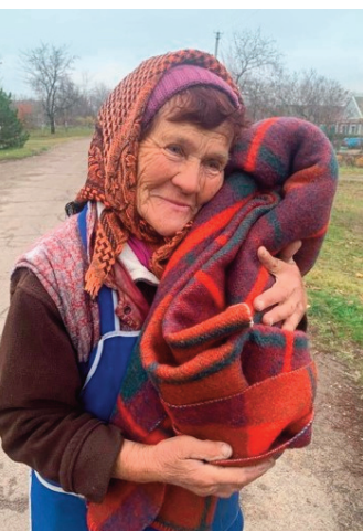
En lykkelig dame som har fått seg et varmt og godt pledd. Det blir godt å ha i nattekulden

og det er veldig store behov for brensel og gass, for strøm og sentralvarme blir jo hele tids slått ut. La oss fortsette å støtte, samtidig som vi ber om fred for dette landet som har lidd så enormt mye opp gjennom historien.