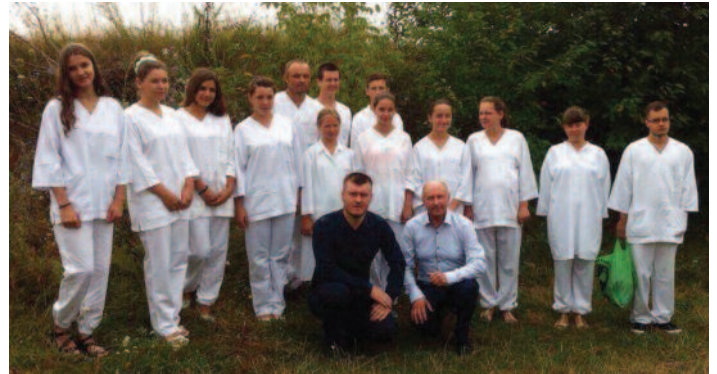
Fra siste dåp i menigheten i Illintsi