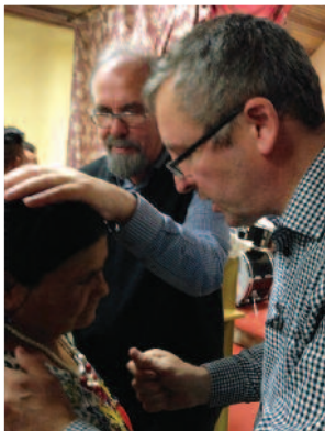
Det er stor nød og lengsel som kommer fram hos mange i ettermøtene, og vi bruker mye tid til samtale og forbønn.

Vårt evangeliske framstøt i Ungarn i november var preget av en veldig sterk atmosfære i alle møtene. Over alt var det mennesker som kom fram og møtte Gud til frelse. Kampanjen var særlig rettet mot sigøyerne, men vi hadde også møter blant flertallsungarere. Også disse samlingene var preget av en sterk åndelig atmosfære. Det var så fint å oppleve at mange kristne, også pastorer og ledere, søkte fram i ettermøtene til forbønn, fordi de ville innvie sine liv til Gud og til en sterkere tjeneste for ham.