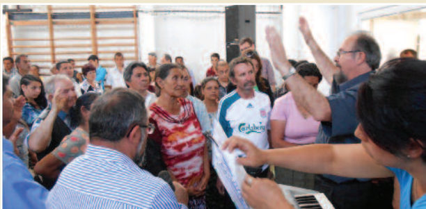
Veldig mange søkte Gud i ettermøtet