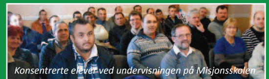
Konsentrerte elever ved undervisningen på Misjonsskolen

Det var utrolig flott å kunne undervise for konsentrerte elever ved Misjonsskolen. Jeg hadde den siste av to leksjoner, og jeg opplevde det særdeles sterkt da veldig mange elever kom fram etter undervisningen og ville innvie seg til tjeneste for Herren.