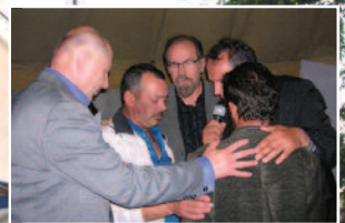
Forbønn for hardt belastede sigøynere som søker Gud

arbeidere, følge opp dette framstøtet med ukentlige besøk. Vi har visjon om at det skal vokse fram en egen menighet i Rayke. Vi fikk også tid til et par møter i hovedkirken i Illintsi. Det ble sterke samlinger hvor mange kom fram for å få fred med Gud. Herren åpenbarte sin kraft for mange, både til ånd, sjel og legeme.