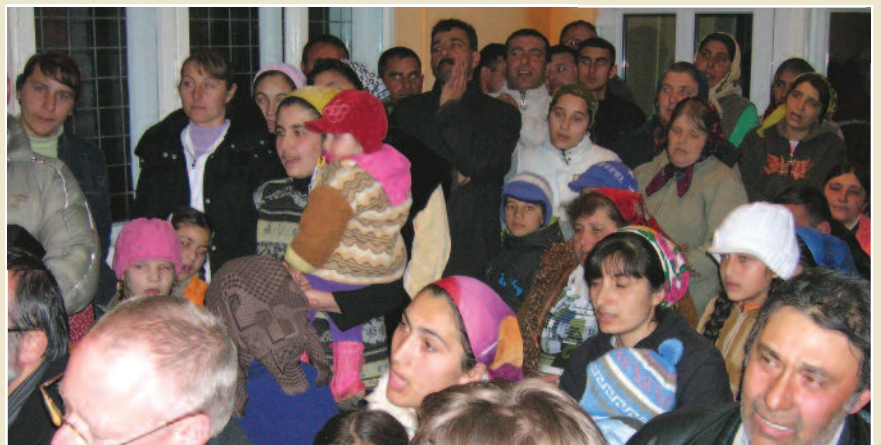
Folk sto tett pakket, som sild i en tønne, for å oppleve Gud i den tidligere puben.

Første gang vi var der var det et pioner-prosjekt. Vi hadde et friluftsmøte hvor noen få sigøynere søkte forbønn. På denne korte tiden har dette utviklet seg til en fantastisk menighet med mange medlemmer. Nå hadde vi møte i en tidligere pub. Lokalet var stuende fullt av åndelig hungre sigøynere, og mange søkte frelse. Det er fantastisk å delta i det som Gud gjør blant dette folket. Dette viser også at det er meget viktig at vi samarbeider med brennende lokale ledere i våre framstøt - slike som kan ta seg av dem som søker Gud, og utvikle dem videre i menighetsfelleskap,