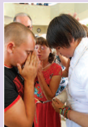
Det var så sterkt å oppleve at unge mennesker kom fram og gjennom tårer søkte Gud for å bli frelst. Det er så mye nød i Ukraina, i ettermøtene var det lange køer av mennesker som søkte Gud for forskjellige behov.