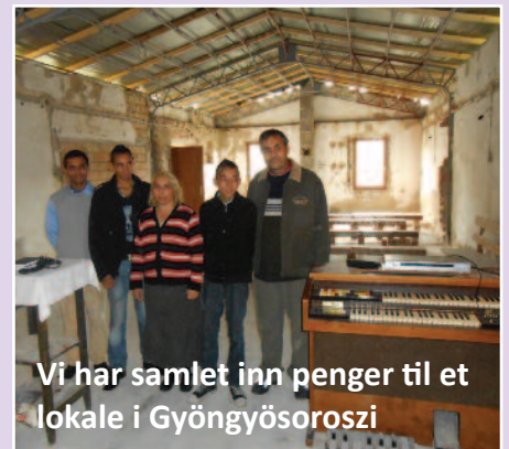
Vi har samlet inn penger til et lokale i Gyöngyösoroszi

Det var fint å se at framdriften i oppbyggingen var i full gang. Det tok lang tid å få alle papirer og tillatelser etc. på plass. Men nå går det relativt fort, selv om det meste gjøres på dugnad. Bygningen er så stor at den blir som et evangelisk senter. Flere menigheter i dette området kan derfor dra nytte av bygningene til ulike evangeliske formål. Menigheten i byen har ikke så mange medlemmer enda, men den vokser stadig. Det er så fantastisk å se den iveren disse sigøynerne gir til kjenne for byggeprosjektet. Straks taket og elektrisitet kom på plass, tok de deler av bygningen i bruk til møtevirksomhet – mens byggingen foregikk. De stablet opp noen mursteiner til stoler, satte inn et gammelt orgel og et bord og satte i gang med møter. Ungdomsgruppen, som bare var noen få personer, har vokst til over 40 på kort tid. Det er så flott at vi kan bidra med hjelp for disse underkuede menneskene som satser så sterkt på Jesus Kristus, og brenner for å spre evangeliet blant sitt folk. Vi er takknemlige for alle som har bidratt med gaver til dette prosjektet. Det gjenstår enda mye, så vi ber til Gud om flere gaver slik at prosjektet kan fullføres.