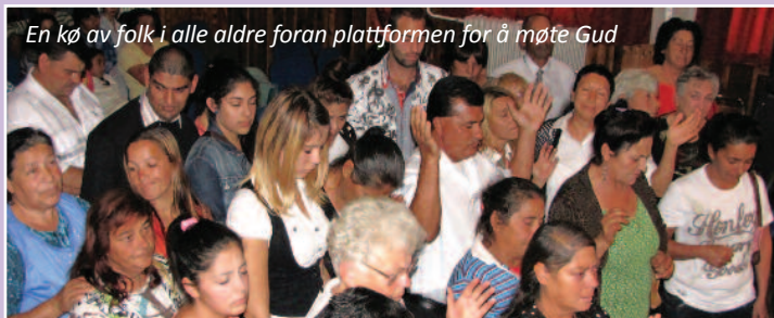
En kø av folk i alle aldre foran plattformen for å møte Gud