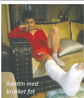
Ramtin med brukket fot

Det fantastiske er jo at både vi og familien selv, ser klart at Herren holder sin hånd over dem. Midt i prøvelsene ser vi mirakel på mirakel. Og vi registrerer at de stråler ut Guds lys i området de bor i. En husmenighet er blitt startet og flere er blitt frelst. De vitner frimodig om Jesus der de bor og mange blir berørt av den atmosfæren de utstråler, og de er til stor hjelp for andre flykninger som lider. Jeg ser helt klart at gjennom prøvelsene former Gud denne familien til noen fantastiske redskaper for Guds rike.