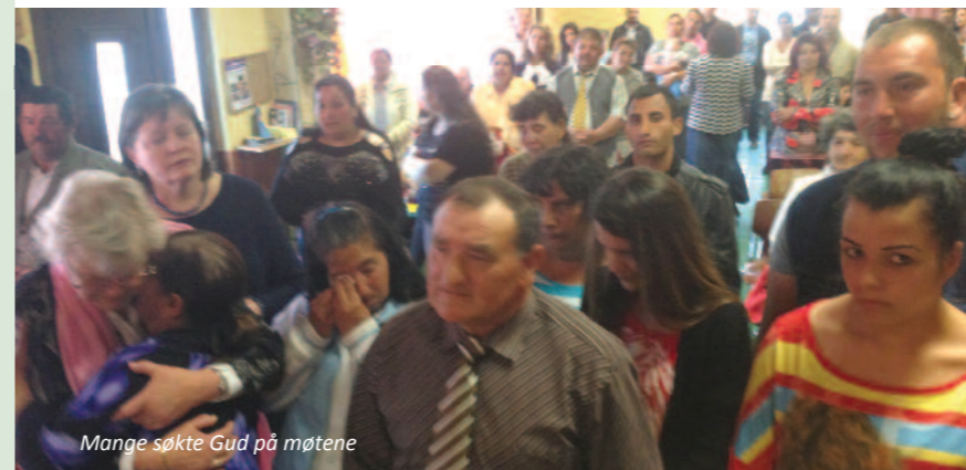
Mange søkte Gud på møtene