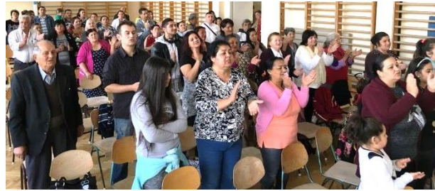
Fra en samling blant sigøynere i oktober - 2017

Allerede i begynnelsen av neste måned reiser min kone og jeg, sammen med et par andre medarbeidere til Ungarn. Undervisning ved Misjonskolen for sigøynere er hovedoppdraget denne gangen, men det blir både evangelisering og besøk i etablerte menigheter.