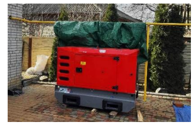
Aggregatet til nærmere kr 100 000 monteres nå i kirken i Illintsi

Bruk bankkto.: 2801 08 06048. - Vipps: 624039. Merk hva betalingen skal gå til: Ukraina - Zahra - Sigøynerne.