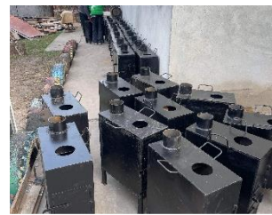
Våre samarbeidspartnere masseproduserer ovner som sendes ut.