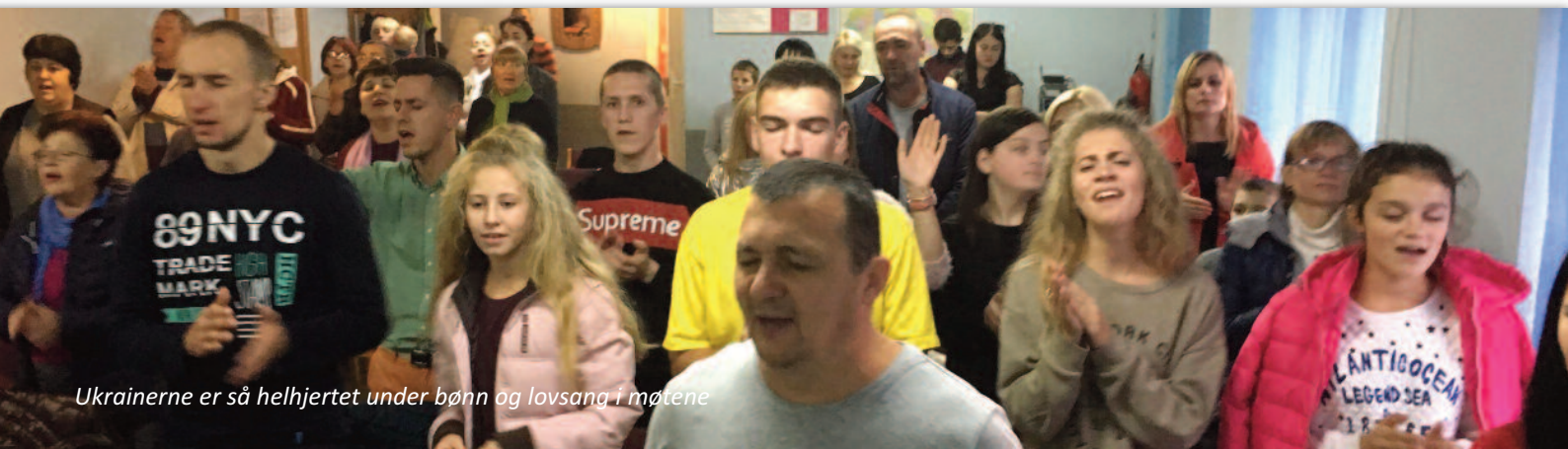
Ukrainerne er så helhjertet under bønn og lovsang i møtene